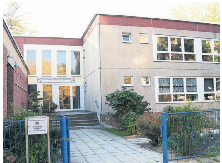
Außenansicht der Kita „Am Klinikum“ in Kolkwitz. Derzeit besuchen diese Kita 41 Kinder. Bis zum neuen Jahr werden hier 80 Plätze geschaffen. Am 9. November wird zum Tag der offenen Tür mit anschließendem Lampionumzug eingeladen.

Mathias Klinkmüller Öffentlichkeitsarbeit