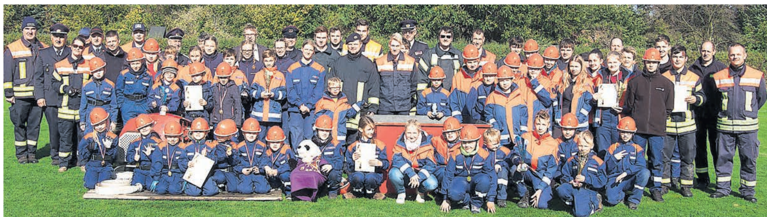
Während nebenan kräftig in die Pedalen getreten wurde, legte sich auch der Feuerwehr-Nachwuchs auf dem Sportplatz am Kolkwitz-Center so richtig ins Zeug. Um beste Ergebnisse wurde beim Gemeindejugendausscheid der Feuerwehren gekämpft.

p.s. Sollte ihr Kind, Interesse an der Kinder- und Jugendfeuerwehr haben, so sprechen sie die Feuerwehr in ihrem Ort an, die Kameraden stellen gerne einen Kontakt her.