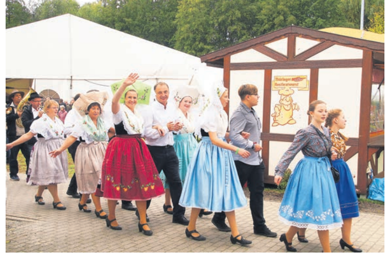
Der Traditionsverein Papitz fiel durch die Trachten wieder besonders ins Auge.

schaft Heimatgeschichte, der Reiterhof Forrest Hill, der Traditionsverein Papitz, der Dorfclub Gulben, der DJ Roland Jainz, die Moderatorin Marion Hirche, die Cottbuser Musikspatzen, der Happy Bibi e.V., die Kinder- und Nachwuchsfunken des KCC, der Verein für Deutsche Schäferhunde OG Kolkwitz, die Chöre des Benefizkonzertes, die Mitwirkenden der trendigen Recycling-Modenschau aus Krieschow, der Clown Rolandi, Bodo Stellmacher, welcher die Bühne mitdekorierter sowie die Bläsergruppe der Kirchengemeinde Kolkwitz.