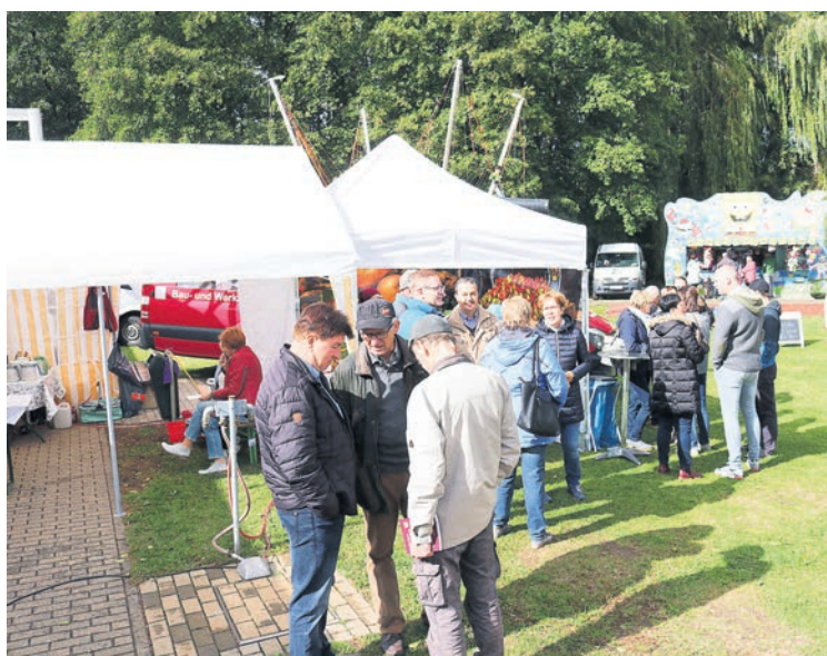
Die CDU verkaufte traditionell Kuchen auf dem Fest. Der Erlös des Basares in Höhe von 800 Euro ging an die ehrenamtliche Tätigkeit der Elterninitiative „Stars for Kids e.V.“, welcher alternative Therapie-möglichkeiten für erkrankte Kinder und Heranwachsende fördert.