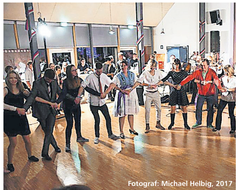
Fotograf: Michael Helbig, 2017

- im Niedersorbischen Gymnasium Cottbus ( www.nsg-cottbus.de ) sowie am Veranstaltungstag zum Preis von 10,00 € (6,00 € erm. für Schüler und Studenten) an der Abendkasse erhältlich!