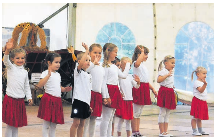
Die Kinder des Happy Bibi e.V. zeigten, wie mitreißend tanzen sein kann.