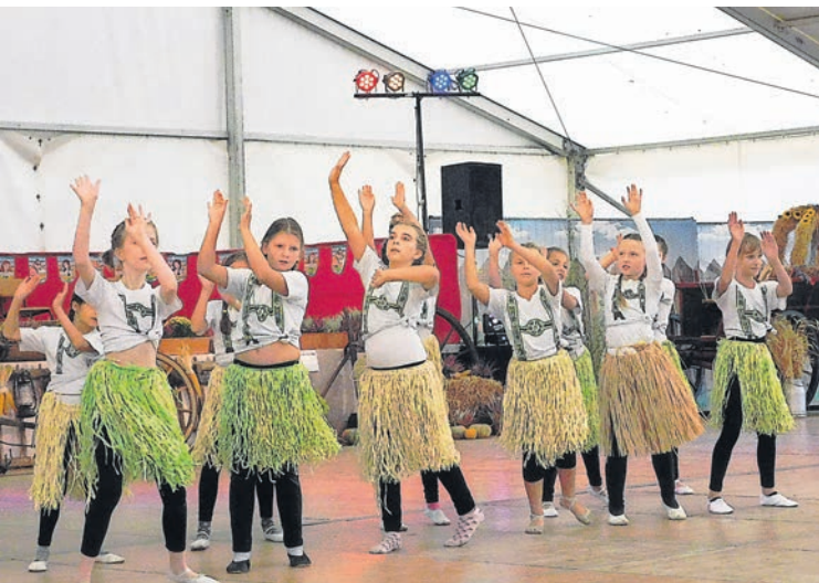
Die Nachwuchsfunken des KCC versprühten jede Menge Lebensfreude auf der Bühne

schaft Heimatgeschichte, der Reiterhof Forrest Hill, der Traditionsverein Papitz, der Dorfclub Gulben, der DJ Roland Jainz, die Moderatorin Marion Hirche, die Cottbuser Musikspatzen, der Happy Bibi e.V., die Kinder- und Nachwuchsfunken des KCC, der Verein für Deutsche Schäferhunde OG Kolkwitz, die Chöre des Benefizkonzertes, die Mitwirkenden der trendigen Recycling-Modenschau aus Krieschow, der Clown Rolandi, Bodo Stellmacher, welcher die Bühne mitdekorierter sowie die Bläsergruppe der Kirchengemeinde Kolkwitz.