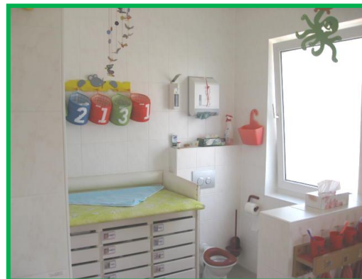
Garderobe und Bad des Krippenbereichs