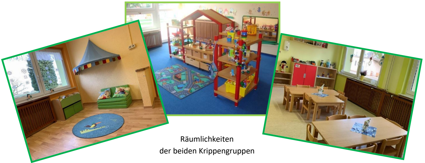
Räumlichkeiten der beiden Krippengruppen

Die beiden Gruppeneinheiten des Krippenbereichs verfügen jeweils über einen Essbereich, Schlafmöglichkeiten sowie Spiel- und Lerninseln, die sich an den Bildungsbereichen orientieren (z.B. Bauecke, Bewegungsecke, Puppenecke mit Kinderküche, Kuschel- und Bücherecke, usw.).