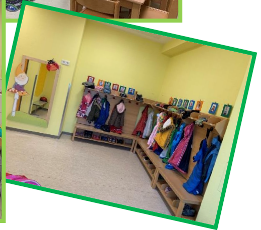
Räumlichkeiten des Kindergartenbereichs

Zu unserer Einrichtung gehört eine Küche, in der die Kindergartenkinder ihr Frühstück einnehmen. Vormittags wird die Küche auch für Lernangebote in den entsprechenden Altersgruppen genutzt.