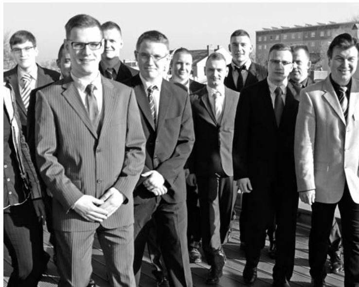
Das letzte Gruppenfoto ist gemacht – am Montag treten 10 frischgebackene Jungfacharbeiter den Dienst in ihren Delegationsbetrieben an