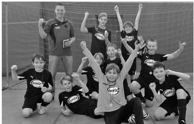
Die D- Jugend holt den ersten Platz beim Hallenturnier in Kolkwitz.