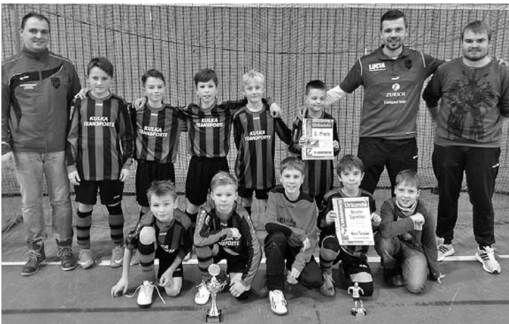
Die E- Jugend holt den 2. Platz beim großen Hallenturnier der SG Frischauf Briesen.