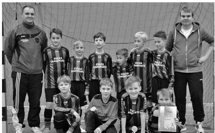
Einen weiteren Pokalsieg holte die E- Jugend beim Hallenturnier von Blau Weiß Vetschau am 24.01.2015!