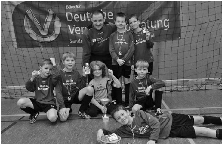
Die F- Jugend wird Pokalsieger beim Koßwiger – Budenzauber!

Fichte weiterhin sehr erfolgreich in der Halle!