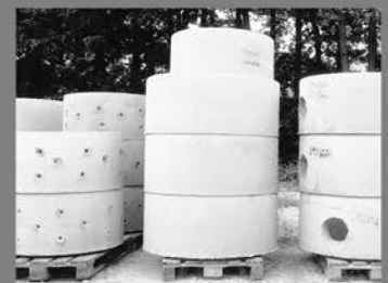
Betonsickerschächte 80-100-125cm Durchmesser