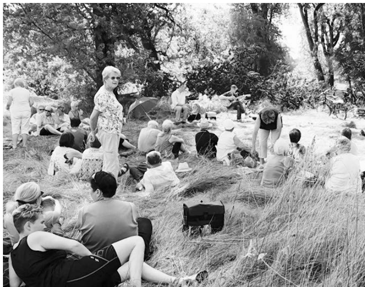
Mit Picknickdecke und Musik an teils noch unentdeckten Orten im Grünen – so geben sich die Stationen des Cottbuser Fahrradkonzerts, das in diesem Jahr am 16. Juli 2017 zum fünften Mal stattfindet und von Cottbus nach Kolkwitz führt

Das Fahrradkonzert wird unterstützt von der LEAG, der Stadtwerke Cottbus GmbH, der GWC, der Gemeinde Kolkwitz und den Veranstaltungspartnern an der Strecke. Mehr zur Route, den Orten und der Musik unter www.fahrradkonzert-cottbus.de .