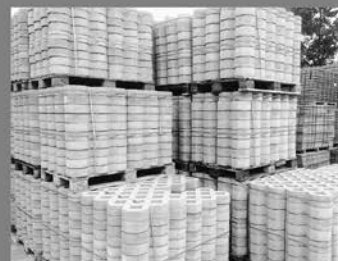
Betonrasengitter 8 & 10cm