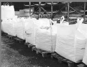
Gabieonenfüllung im BIGBAG oder lose, Zierkies in 25kg Sack

Ständig ausreichende Mengen am Lager, zu Top Preisen ob für das Großprojekt oder den Vorgarten, wir haben das richtige.