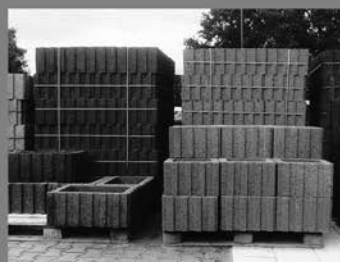
Hangflor und Rasterflor