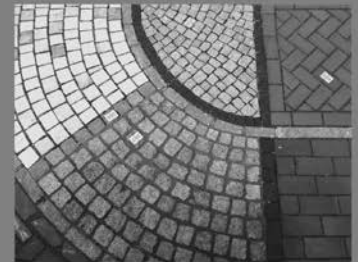
Natursteinpflaster verschiedene Farben in 3 Größen am Lager