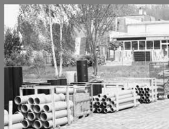
KG-Rohr & Kontrollschächte