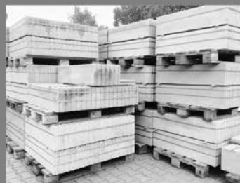
Beton-Rasenbord 5 & 6 cm - Tiefbord 8 oder 10 cm