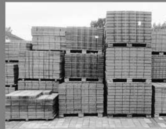
Standard Betonpflaster 6 & 8 cm