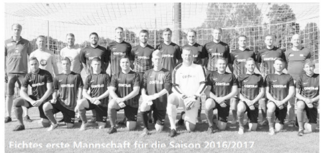
Fichtes erste Mannschaft für die Saison 2016/2017

Am Ende ein leistungsgerechtes Unentschieden. Die Zuschauer waren sehr zufrieden.