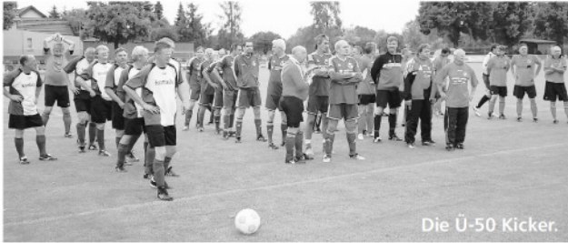
Die Ü-50 Kicker.

Das Sportfest 2016 stand ganz im Sinne des 95-jährigen Jubiläums unseres Sportvereins. Wie schon in den vergangenen Jahren stand auch in diesem Jahr wieder der Fußball im Mittelpunkt des Geschehens. So begannen am Freitag die Ü50 Fußballer mit ihrem Turnier. Immer wieder ein sehr interessanter Termin. Viele Ehemalige Spieler der Fichte und auch der Gastvereine treffen sportlich, aber vor allem freundschaftlich, aufeinander. Bei vielen alten Geschichten klingt der Abend oft erst in den Morgenstunden aus.