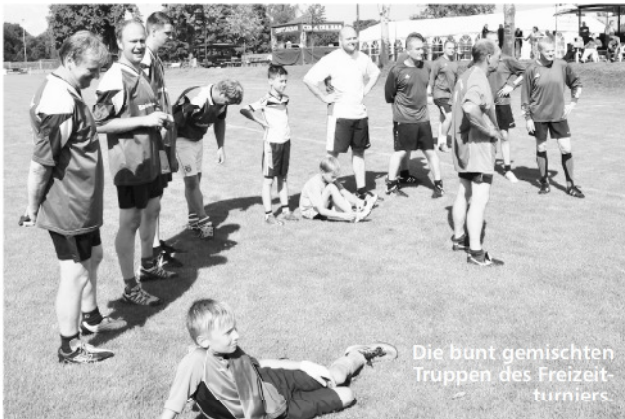
Die bunt gemischten Truppen des Freizeitturniers.

Der Samstag startete erst einmal mit viel Regen. Zum Glück nur eine gute Stunde, dann konnte wieder gekickt werden. Beim Freizeitturnier sicherte sich die Dahlitzer Straße vor der Familie Badack den Pokal.