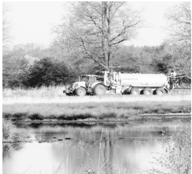
Gülleausbringung im Brodtkowitzer Lugk