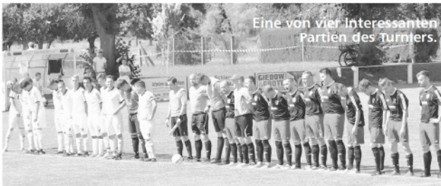
Eine von vier interessanten Partien des Turniers.

So gewann Krieschow II vor Kunersdorf. Auf Platz 3 landet Kolkwitz II, den vierten Rang belegten die Klein Gaglower.