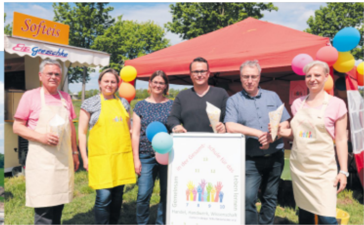
Der Schulförderverein nutzte das Familienfest der Grundsteinlegung um mit den Gästen ins Gespräch zu kommen und Popcorn zu verkaufen.