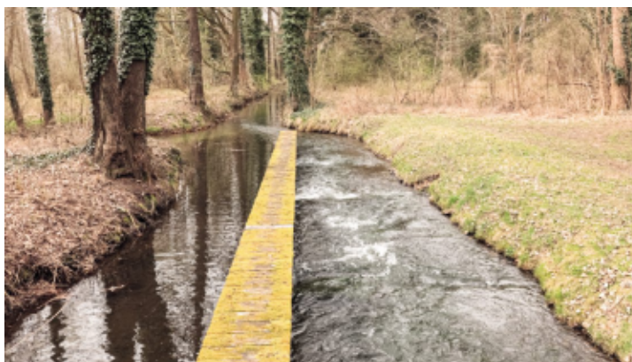
Blick von der Brücke Richtung West: Die neu gebaute Fischtreppe ist rechts zu sehen; links läuft das Wasser wie bisher mit Gefälle durch das Wehr. Hinten links ist der Einlauf des Moorgrabens zu sehen; dieser verschmutzt den Priorgraben, der hinten weiterläuft gen Westen.