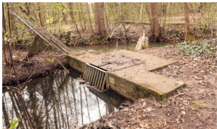
Hier wird das abgetrennte saubere Priorgrabenwasser unter dem Moorgraben durchgeleitet, der durch das Raseneisenerz der Sachsendorfer Wiesen braun verschmutzt ist.

Die Interessengemeinschaft Heimatgeschichte sind die im Ehrenamt tätigen Archivare der Gemeinde und sorgen darüber hinaus dafür, dass die Heimatgeschichte auch erzählt wird und somit lebendig bleibt. Wer hier gerne mitmachen und das Team unterstützen kann, ist herzlich willkommen. Einfach in der Gemeindebibliothek unter 0355 28416 melden. Die Interessengemeinschaft freut sich auf Sie!