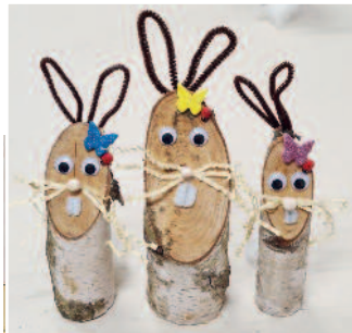
Foto-Eindrücke vom diesjährigen Osterbasteln der Jugendfeuerwehr Limberg