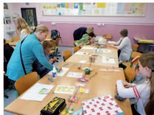
Es gab auch viele kreative Bastelangebote.