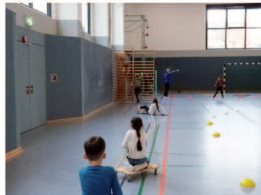
Als Ausgleich gab es sportliche Aktivitäten.