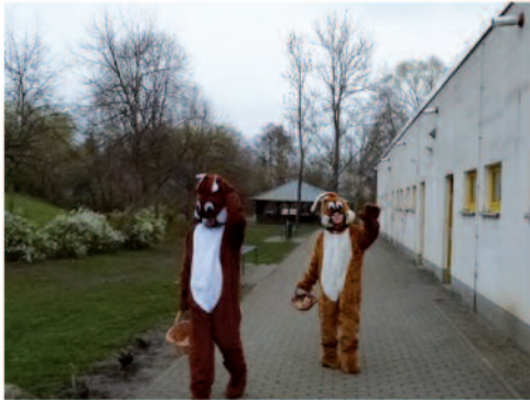
Die Osterhasen duften natürlich nicht fehlen.

Auch 2024 hatten wir unser jährliches Osterprojekt mit vielen verschiedenen Stationen zum Mitmachen und Nachmachen mit viel Freude und Spaß.