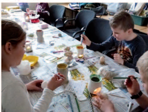
Das traditionelle Ostereier bemalen ein Muss beim Projekttag.