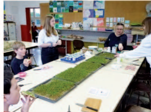
Hier wurden frisch zum Frühling leckere Brote zubereitet.