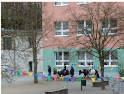
Als besonderes Highlight konnten die Schüler Ponys reiten.